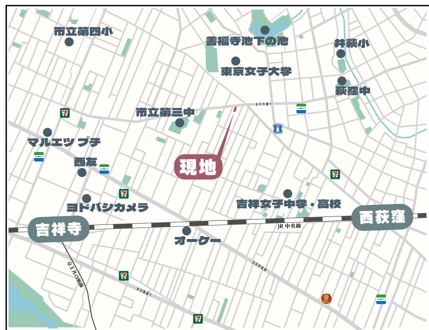
カーナビへのご入力・武蔵野市吉祥寺東 3-7